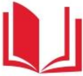
Логотип трека «Орлёнок – Эрудит»